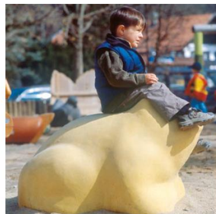
Order No. 4.63010 Frog, yellow