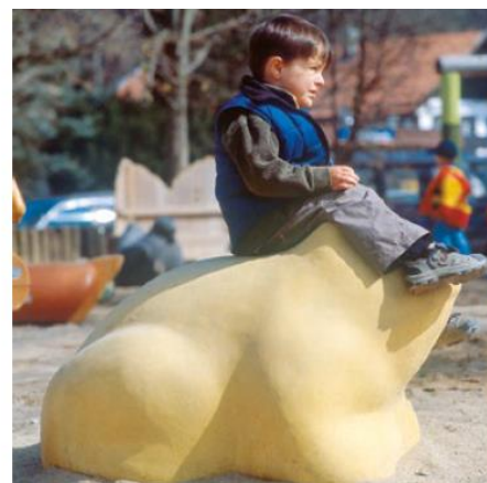
Order No. 4.63010 Frog, yellow