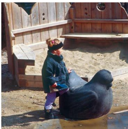
Order No. 4.68060 Chicken, charcoal

Łagodny charakter naszych betonowych rzeźb – zabawek wprowadza wspaniałą atmosferę na plac zabaw, na którym są one zainstalowane. Żółwie, misie, koty, foki, pomimo że są wykonane z betonu, to bardzo chętnie są przez dzieci przytulane, głaskane i wykorzystywane do zabawy indywidualnej i zabawy w grupie. Zwierzątka są lubiane przez dzieci, dobrze się im kojarzą, rozluźniają stres związany z obcym miejscem i często są jedyną atrakcją czyniącą plac zabaw miejscem godnym zapamiętania.