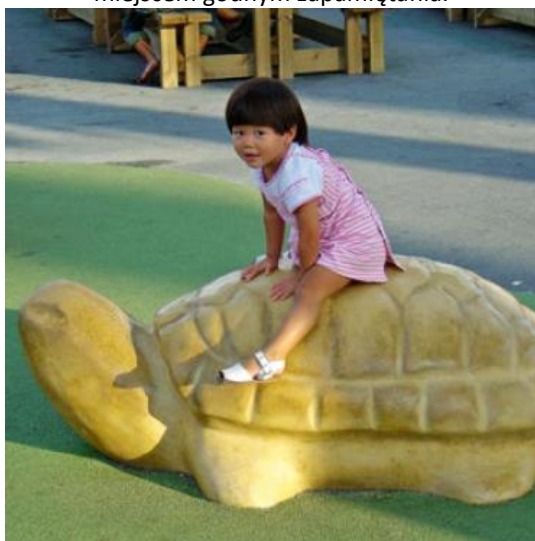
Order No. 4.64010 Turtle, yellow